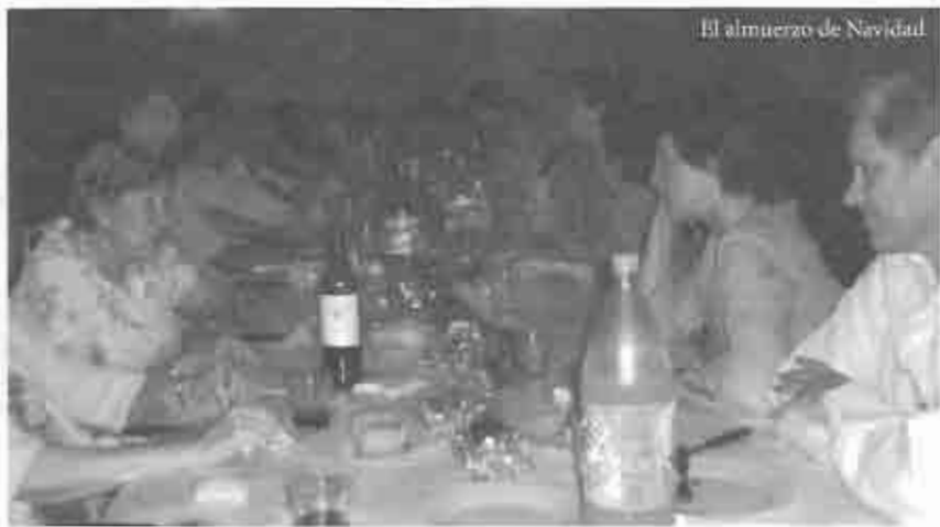
El almuerzo de Navidad.